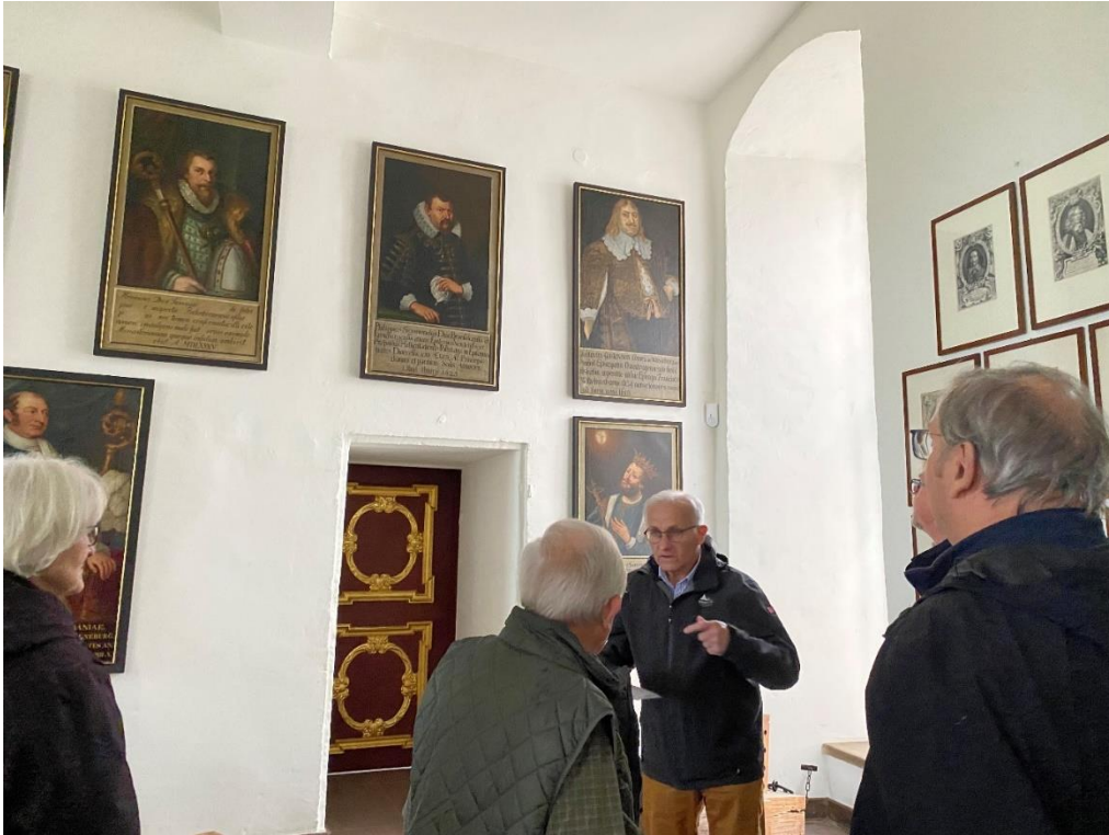
Im Treppenhaus vor dem Rittersaal