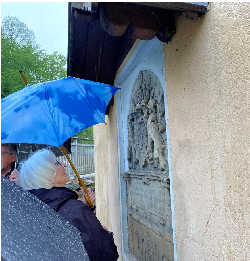
Relief an der heutigen Schlossmühle